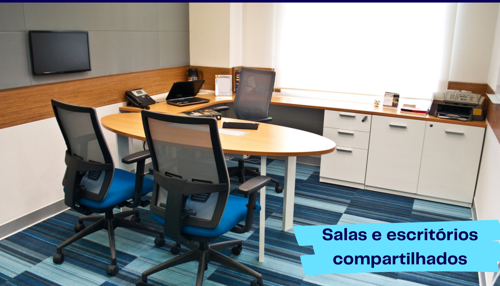
Salas e escritórios compartilhados